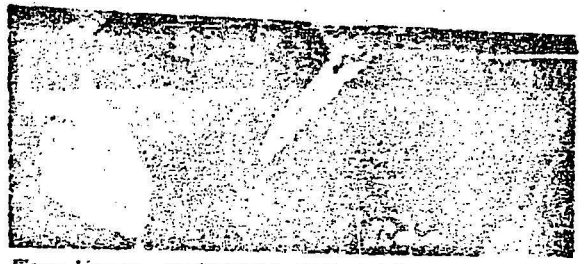
Tony Varona, intelectual y poeta cubano ampliamente conocido en el continente americano. Ayer dio trascendentales declaraciones para J.A. NACIÓN a nuestro redactor Santiago Peñafiel.

—Sin embargo los miles de cubanos que lograron salir de Cuba no están unidos, como fuerza de choque. —La división observada, es una división que aparenta que efectivamente es un hecho real: todos los cubanos unidos en la meta común de derrotar a Fidel Castro y todos están unidos para restablecer el orden representativo y la Constitución de 1940. La división cubana, es una muestra de nuestra energía y de una que es cada vez favorable. —Nuestro requerimiento la idea