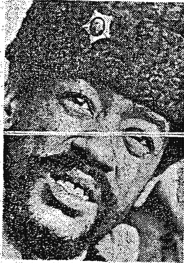
Lederen for det amerikanske «Black Panthers»-parti, Bobby Seale, ved ankomsten til Fornebu.

— Vi godtar ikke betegnelsen «krigersk» (militant). Vi hevder nødvendigheten av selvforsvar, det har vist seg å være nødvendig. Selv Martin Luther King var ikke frem-