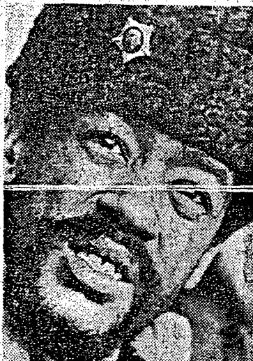
Lederen for det amerikanske «Black Panthers»-parti, Bobby Seale, ved ankomsten til Fornebu.

— Vi godtar ikke betegnelsen «krigersk» (militant). Vi hevder nødvendigheten av selvforsvar, det har vist seg å være nødvendig. Selv Martin Luther King var ikke frem-